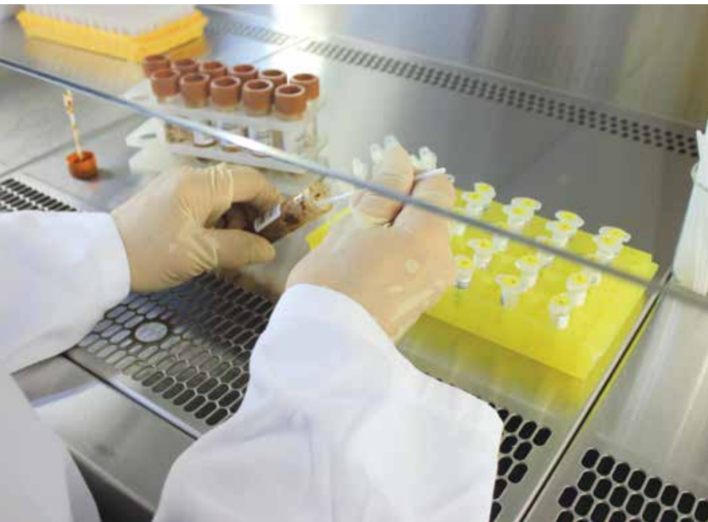
Vorbereitung der Stuhlproben für die Analyse des Darmmikrobioms.

ALZHEIMER Eine Studie der Universität Kiel und des UKSH zeigt Auffälligkeiten im oralen Mikrobiom schon Jahre vor Ausbruch der Erkrankung.