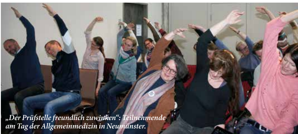
„Der Prüfstelle freundlich zuwinken“: Teilnehmende am Tag der Allgemeinmedizin in Neumünster.