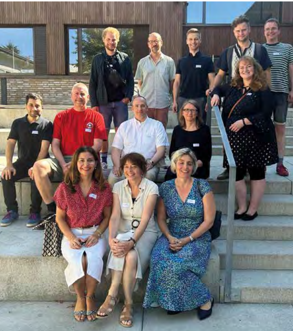
Gruppenfoto vom Didaktiktraining des Kompetenzzentrums Weiterbildung Allgemeinmedizin Schleswig-Holstein (KWA.SH) im Herbst 2023 in Bad Segeberg.

projekten zu arbeiten, sowie an interessierte neue Referierende, die im Rahmen der Didaktikschulung ihre Ideen für Seminare oder Workshops an die Zielgruppe des KWA.SH anpassen wollten. Eingeladen waren auch ÄiW des KWA.SH, die künftig selbst Weiterbildung im Sinne des Peer-to-Peer-Teachings mitgestalten möchten.