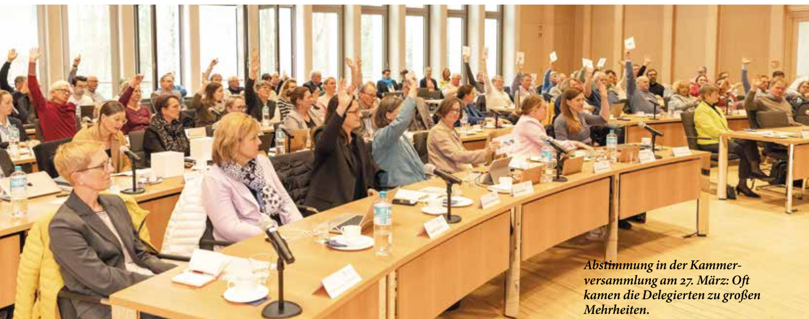
Abstimmung in der Kammerversammlung am 27. März: Oft kamen die Delegierten zu großen Mehrheiten.