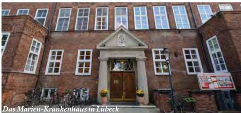
Das Marien-Krankenhaus in Lübeck