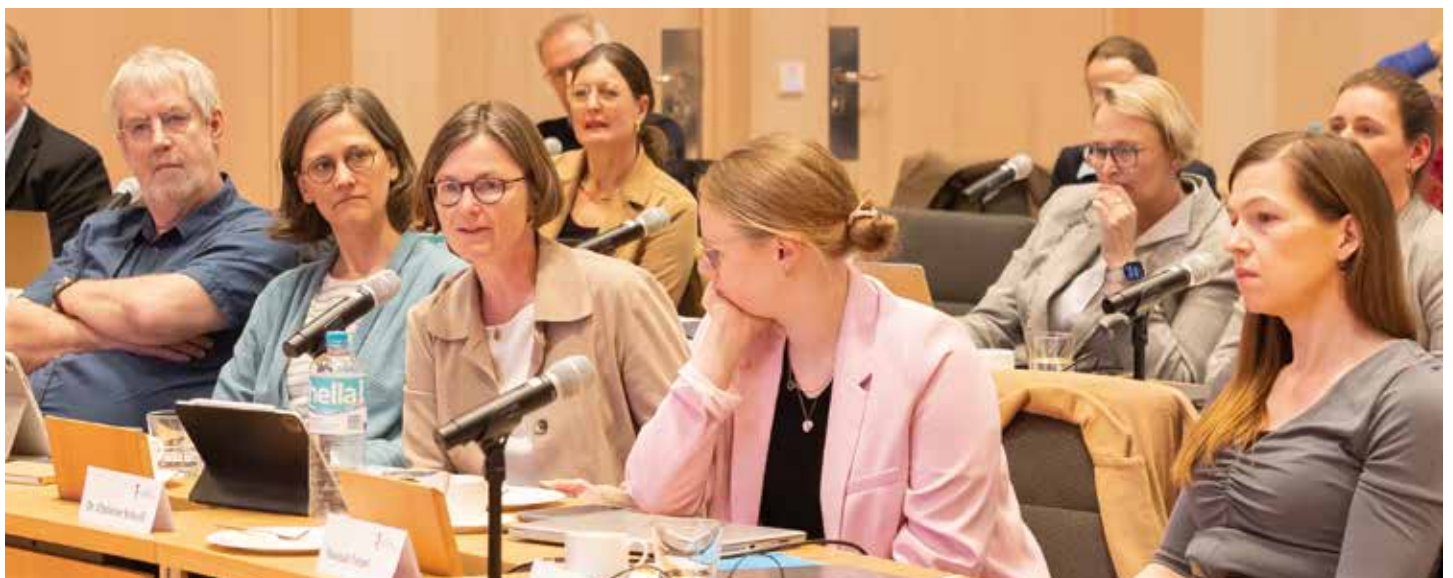
Der neue Vorstand ohne Präsident und Vizepräsidentin in der jüngsten Versammlung.